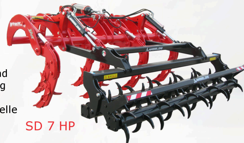
SD 7 HP