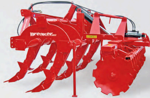
Scheibenegge mit gezackten Scheiben und hydraulischer Einstellung.