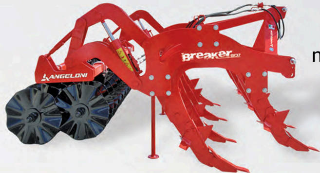
Doppel-Wellenscheibenegge mit hydraulischer Einstellung.