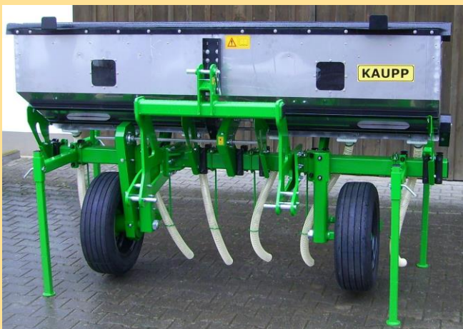
Fahrwerk mit Luftbereifung