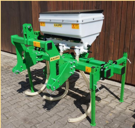
RD 3P - PVC Behälter, mit 3 Dosiereinheiten