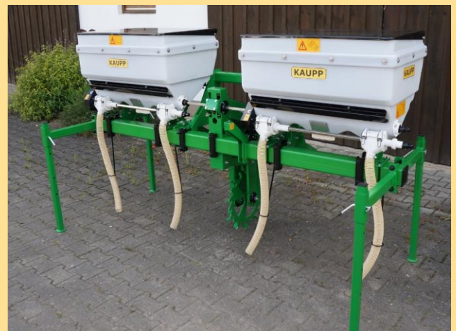
RD 4 mit 2 PVC-Behältern