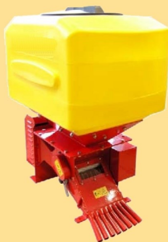
Super 8, 300 | Behälter