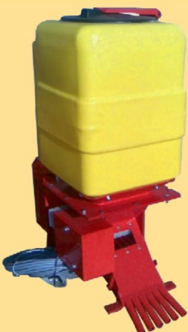
Super 6 130 | Behälter

Geschwindigkeitsabhängige Ausbringung über Sensor an Rad oder Walze, bzw. über Traktormeter-Signal, Auf/Ab-Sensor, Saatmenge nachregelbar über Steuerung, Kalibrierfunktion, Anzeigen: Geschwindigkeit km/h, Saatmenge kg/ha, kg total, Hektarzähler, akustische Warnsignale.