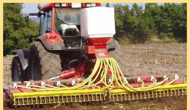
Super 12 400 | Behälter